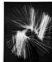
Karen Stuke copyrightberlin